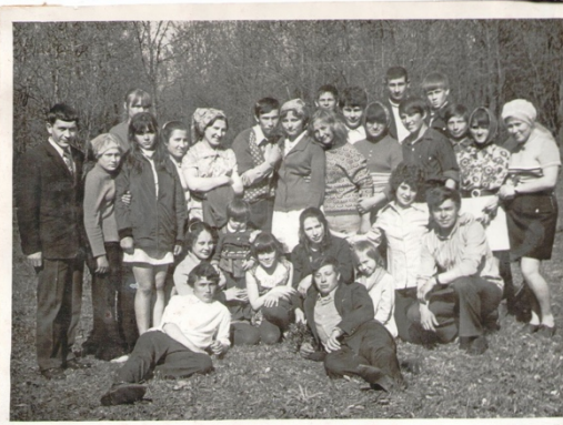
Дмитровская молодежь 70-х лет прошлого века. Фото 1974г.