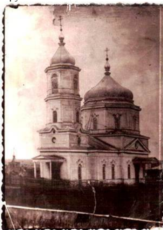
Фото 1. Церковь с колокольней во имя Пресвятой троицы, село Среднее Аверкино (Эверккель). Начало XX века.

Здание церкви в селе Среднее Аверкино 1 было построено на средства жителей села в 1893 году. Одноэтажное, деревянное, оно было рассчитано на 700 душ мужского пола. Имелась собственная земля - 66 десятин, и ещё усадебная - 1 сот. десятина. Дома у причта были общественные, деревянные, также на церковной земле. На содержание причта ежегодно от общества полагалось выделять 350 рублей.