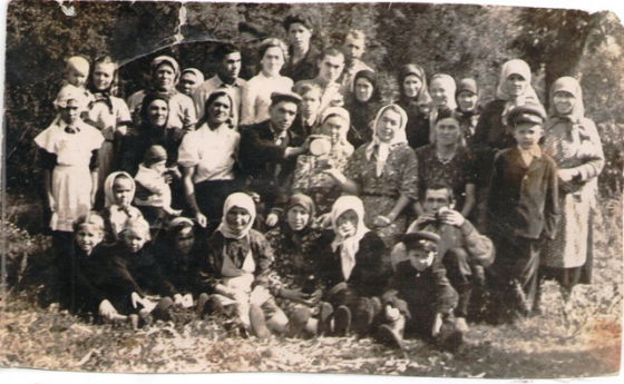
Жители п. Дмитриовка в "Тролица" ("Галик") 1958г июнь.